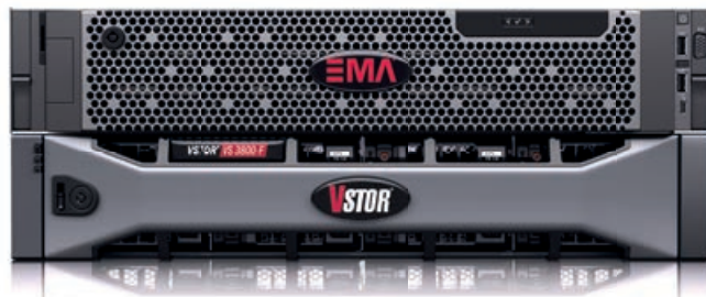
▲ Optimal aufeinander abgestimmt: EMA® im Zusammenspiel mit der VSTOR®-Serie.

Datensicherheit geht häufig auch mit vielfältigen gesetzlichen Anforderungen einher. Dem Gesetzgeber geht es unter anderem um Unveränderbarkeit von Dokumenten oder eine lückenlose und geschützte Aufbewahrung. Diese Anforderungen lassen sich mit EMA® als rechtskonformes Live-Archiv hervorragend erfüllen. Alle Daten werden gemäß den gesetzlichen Anforderungen archiviert. Dabei stehen die geforderte Unveränderbarkeit sowie der Schutz vor Manipulationen im Fokus. Darüber hinaus können unternehmenseigene Compliance-Strategien individuell umgesetzt werden. Dies umfasst beispielsweise die Erfüllung von Auskunftspflichten oder die Einhaltung von Lösch- und Aufbewahrungsfristen, was insbesondere bei der europäischen Datenschutzgrundverordnung (EU-DSGVO) eine große Rolle spielt.